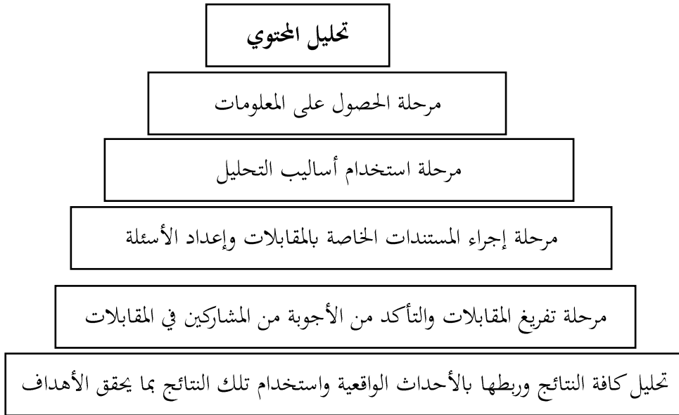
الشكل ٤,١: تحليل المحتوى

أكد براون (٢٠١٣) أن تحليل المحتوى سوف يساهم في إعادة استخدام النتائج التي تم الحصول عليها من مشاركات العاملين في مركز مصراتة الطبي بما يخدم تحقيق أهداف الدراسة، وسوف يتم استخدام المقابلات من أجل تحقيق الهدف الأول في الدراسة، حيث يمكن استخدام تحليل المحتوى للتعرف على المنظور الإسلامي في العلاقة بين الإبداع التنظيمي وبين الأداء الوظيفي بمركز مصراتة الطبي في ليبيا.